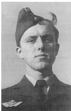
Fot. 4. Nils Fuglesang

I mars 1942 seilte han til Storbritannia for å delta i krigen, og havnet først på RAF-stasjonen Ternhill i Shropshire 8 , der han lærte å fly et «ekte» jagerfly 9 , og deretter ved No.58 Operational Training Unit i Grangemouth, Skottland, der han i to måneder fløy britiske Miles Master Mk. III-fly. Etter denne siste opptreningen begynte han 14. juli tjenesten som jagerpilot med sersjants grad i den norske 331 RAF Skvadron i North Weald, Essex, der han endelig begynte å fly Supermarine Spitfire-maskiner 10 .