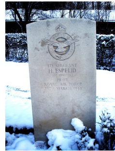
Fot. 9. En ensom norsk grav i Poznań

Gravstøtten over Halldor Espelid står nå blant de 47 øvrige ofrene fra den mislykkede rømningen, to meter fra gravstenen til Roger Bushell, hjernen bak Den store flukten.